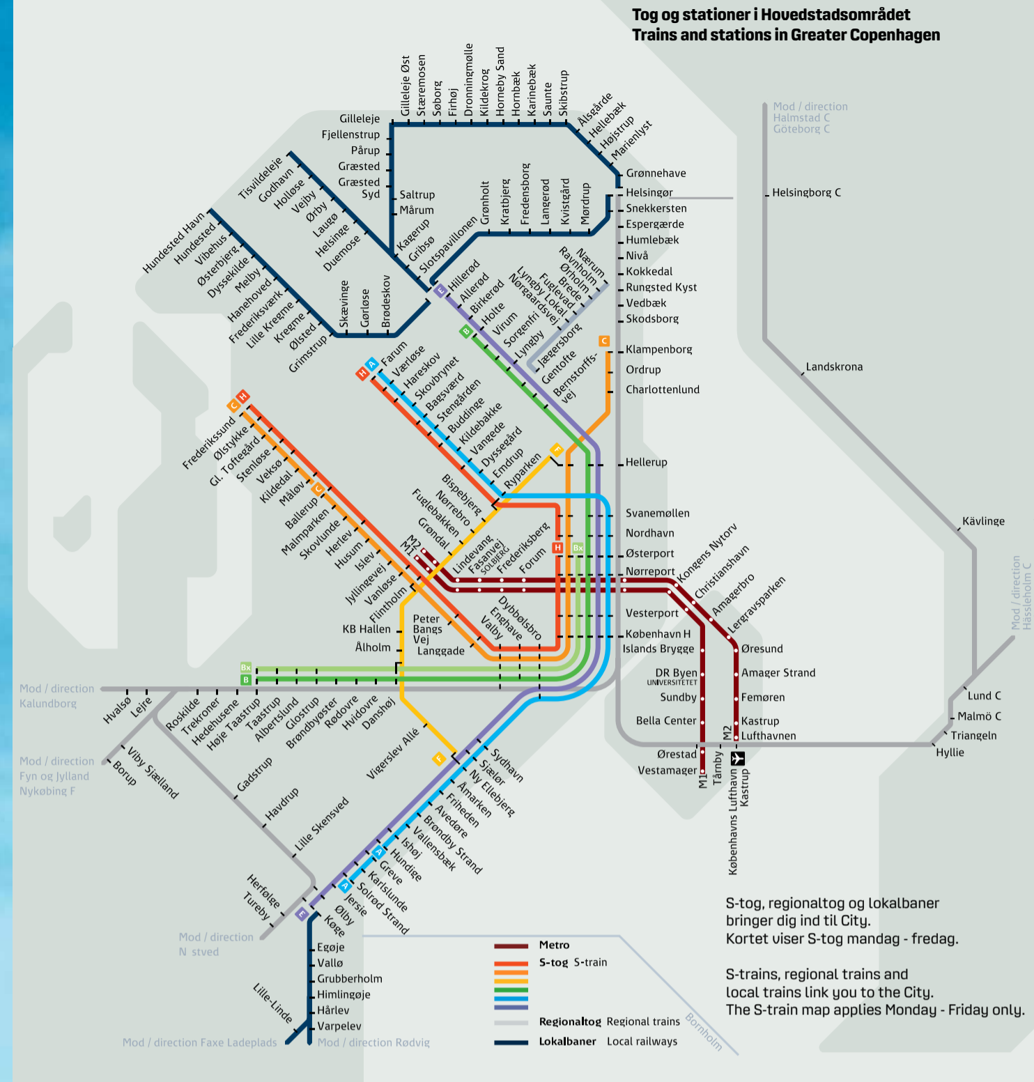
Tog og stationer i Hovedstadsområdet Trains and stations in Greater Copenhagen

Barnevogne kan, hvis der er plads, medtages kuit og frit i bus, tog og metro hele døgnet, når de bruges til transport af børn.